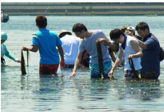
アマモの花枝を丁寧に採取