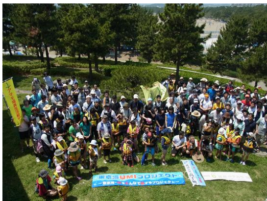
活動内容説明後、記念撮影