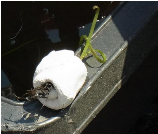
アマモの苗を粘土に括りつける