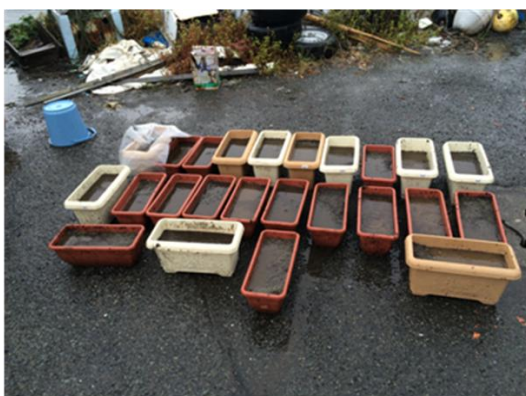
○種蒔を終えたプランター(24個)