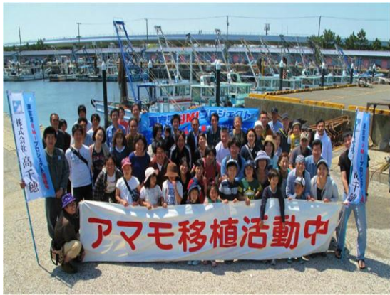
活動内容説明後、記念撮影