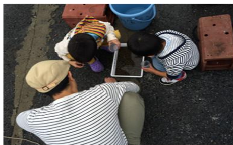
○アマモの種を100粒毎に小分けする