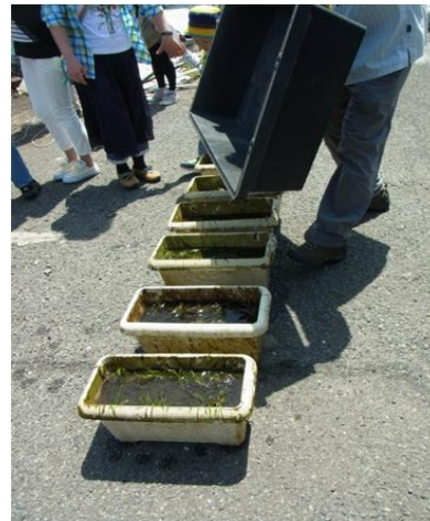
よく育ったアマモの苗