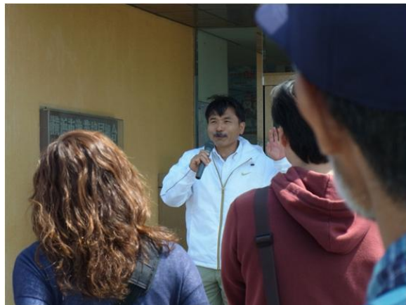
実施企業である(株)高千穂坂本氏