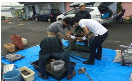
○腐葉土をフルイにかける