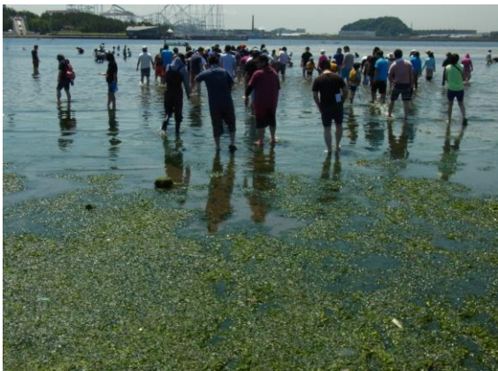
アマモが育っている場所へ移動