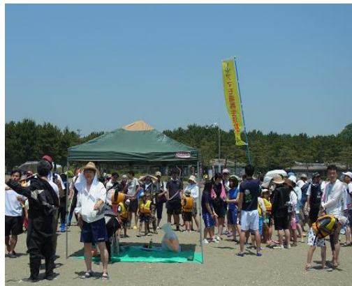
ライフジャケット着用