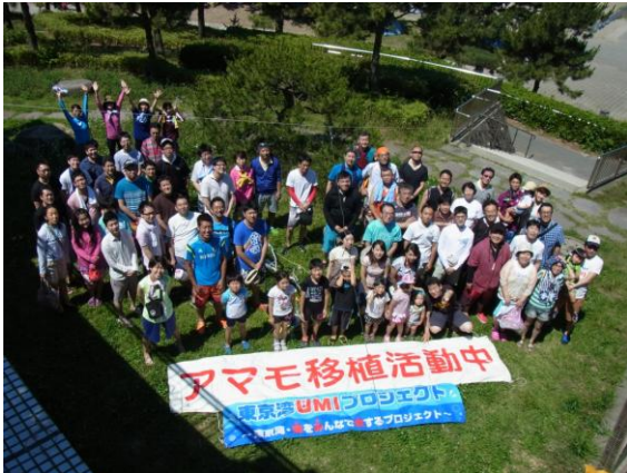
全体説明後、記念撮影