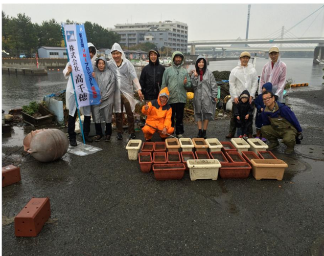
記念撮影:雨の中作業を終える参加者