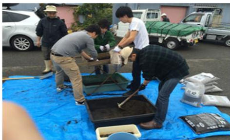
○腐葉土と川砂を混合する