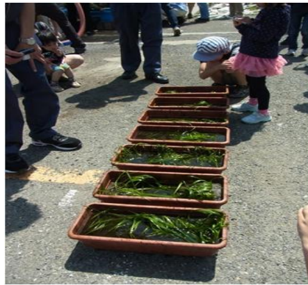
よく育ったアマモの苗