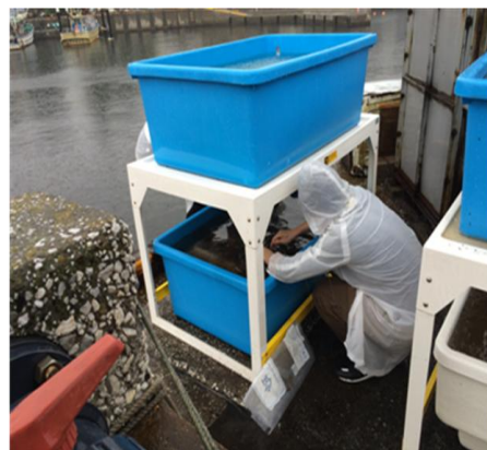
○プランターを大型の水槽に入れる作業