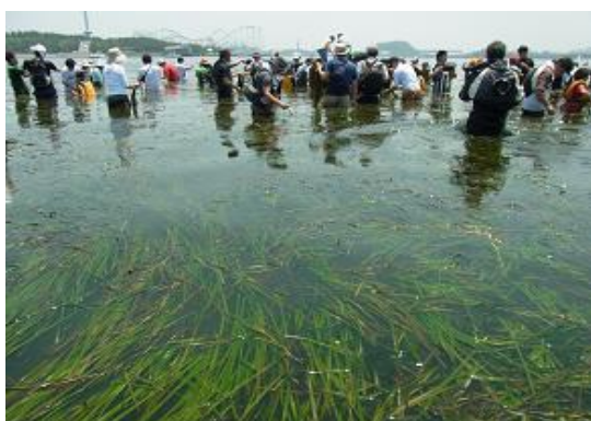
アマモが群生する海の公園