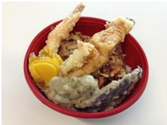
柴漁港で取れたアナゴ（食育）