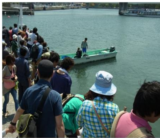
ダイバーによる移植 デモンストレーション