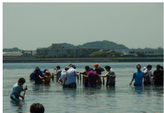
アマモが群生している状況が 遠くからでも確認できる