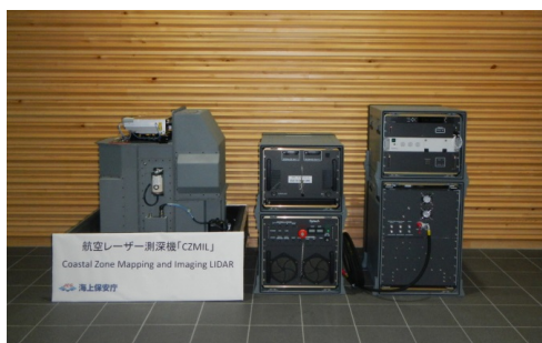
航空レーザー測深機「CZMIL」

航空レーザー測深機「CZMIL」により得られた点群データ。海底から海上の防波堤までシームレスかつ詳細な点群データが得られている。また図左上の防波堤には防波堤を修復する作業船の様子が捉えられている。