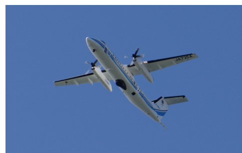
測深中の海上保安庁航空機 MA725